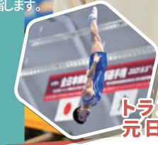
トランポリン競技 元日本代表選手